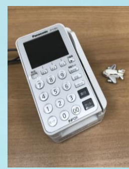
カード決済等、非接触でのお支払いにご協力をお願いいたします。