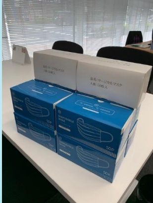
従業員へマスクの配布。