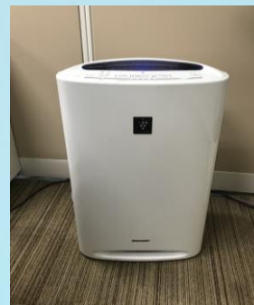
店舗内の換気、清掃を徹底いたします。