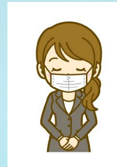
スタッフはマスク着用にて対応いたします。