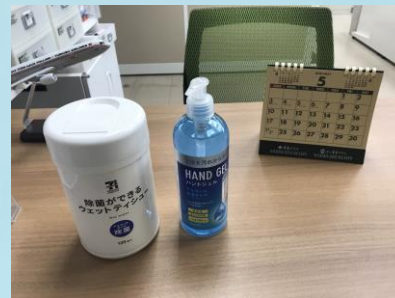
店頭内に消毒設備を設置しております。