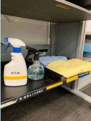
事務所内消毒液の増設。