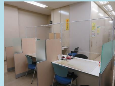
カウンターにアクリル板を置き飛沫完全防止をしております。