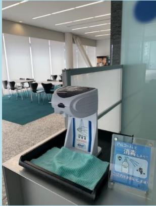
事務所入室時の消毒を実施。